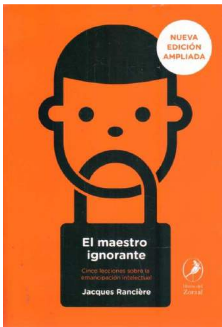
Título: El maestro ignorante: cinco lecciones sobre la emancipación intelectual. | Autor: Jacques Rancière | Ed. Libros Del Zorzal. Año: 2016 (1987) | Ciudad: Bs. As. | Pp.: 256

Quienes se animan a recorrerlo, ponen en quiebra el sistema que nos atraviesa desde años, aquella idea arcaica de poner al maestro en una tarima vomitando saberes sin recibir nada del otro lado. Invertir el orden es animarse a crear sin repetir.