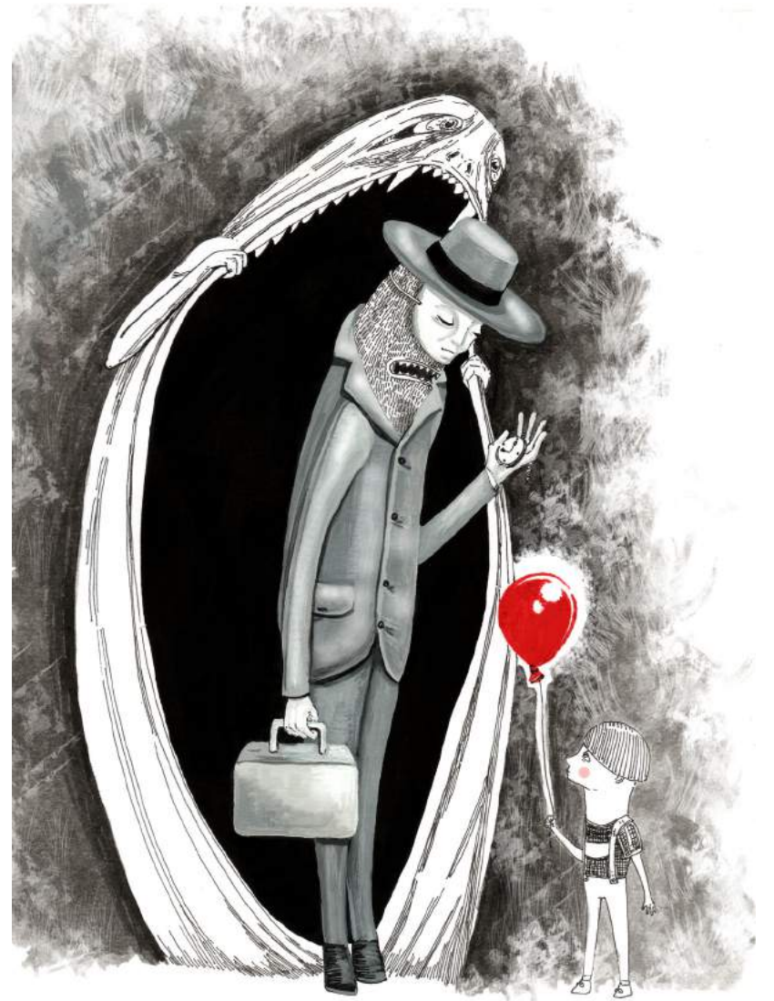
Título: Un hombre gris | Año: 2017 | Medidas: 15 x 21 cm | Técnicas: Tinta estilográfica, tempera y retoque digital. Ilustración originalmente realizada para la convocatoria "Pesadillas" de Calamar | facebook: @calamarilustracion